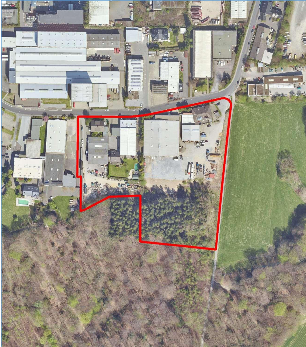
Luftbild © Amt für Liegenschaftskataster und Geoinformation, Rheinisch-Bergischer Kreis, 2020