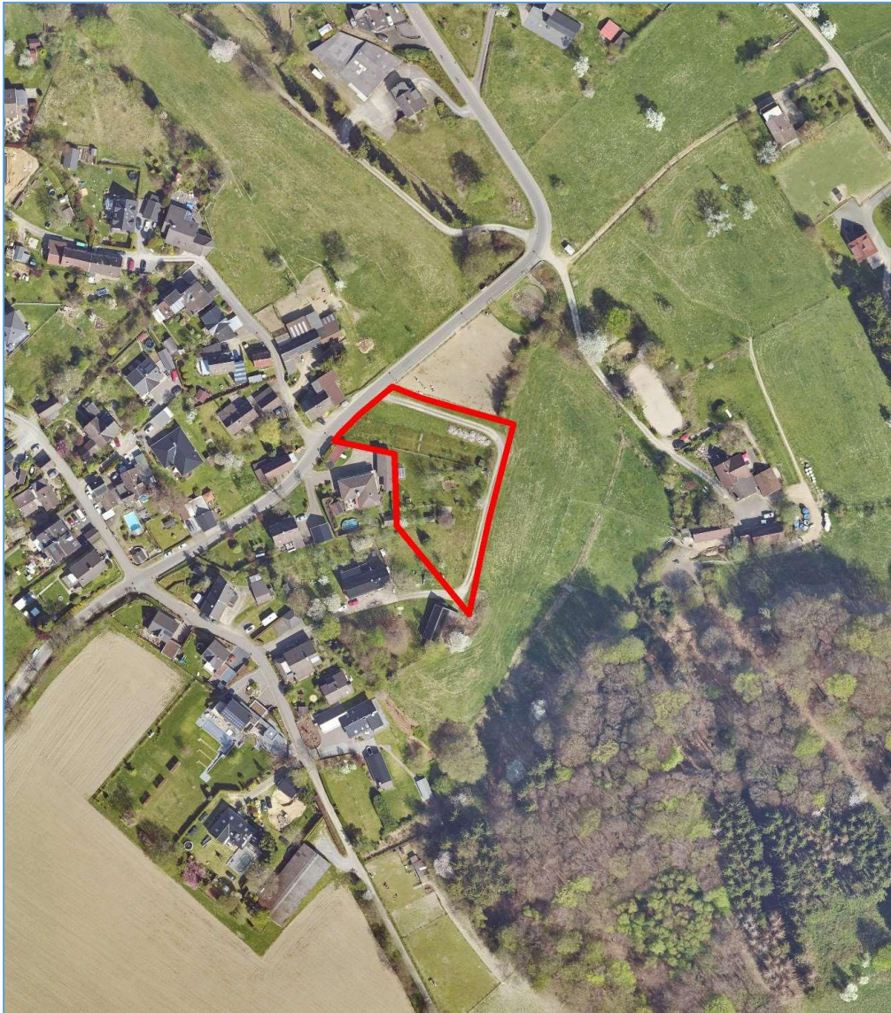
Luftbild © Amt für Liegenschaftskataster und Geoinformation, Rheinisch-Bergischer Kreis, 2020