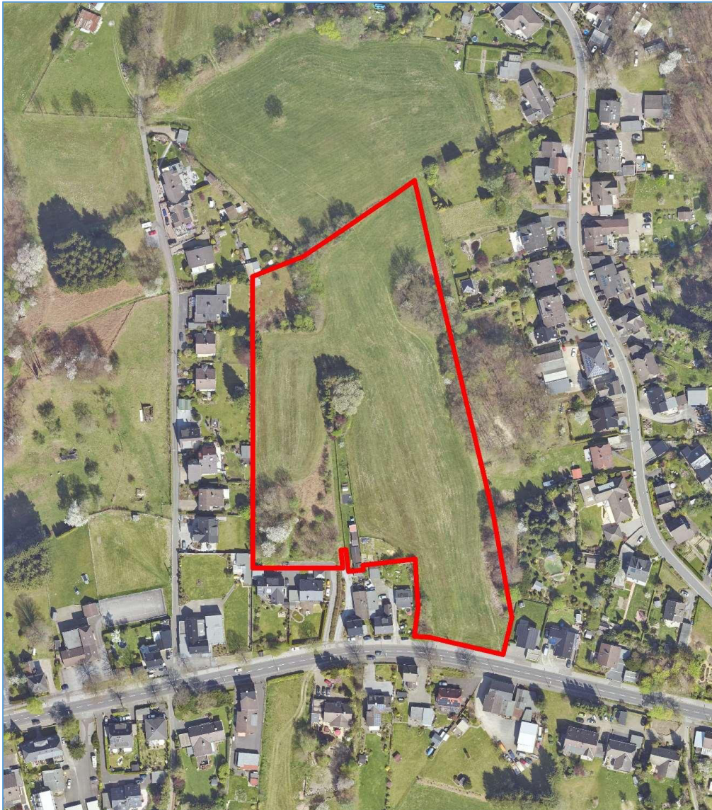
Luftbild © Amt für Liegenschaftskataster und Geoinformation, Rheinisch-Bergischer Kreis, 2020