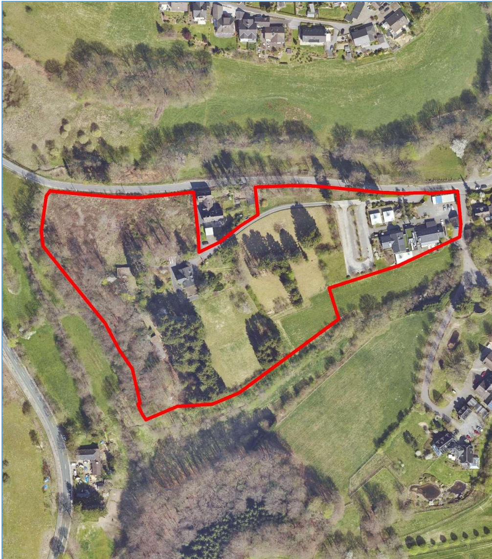
Luftbild © Amt für Liegenschaftskataster und Geoinformation, Rheinisch-Bergischer Kreis, 2020