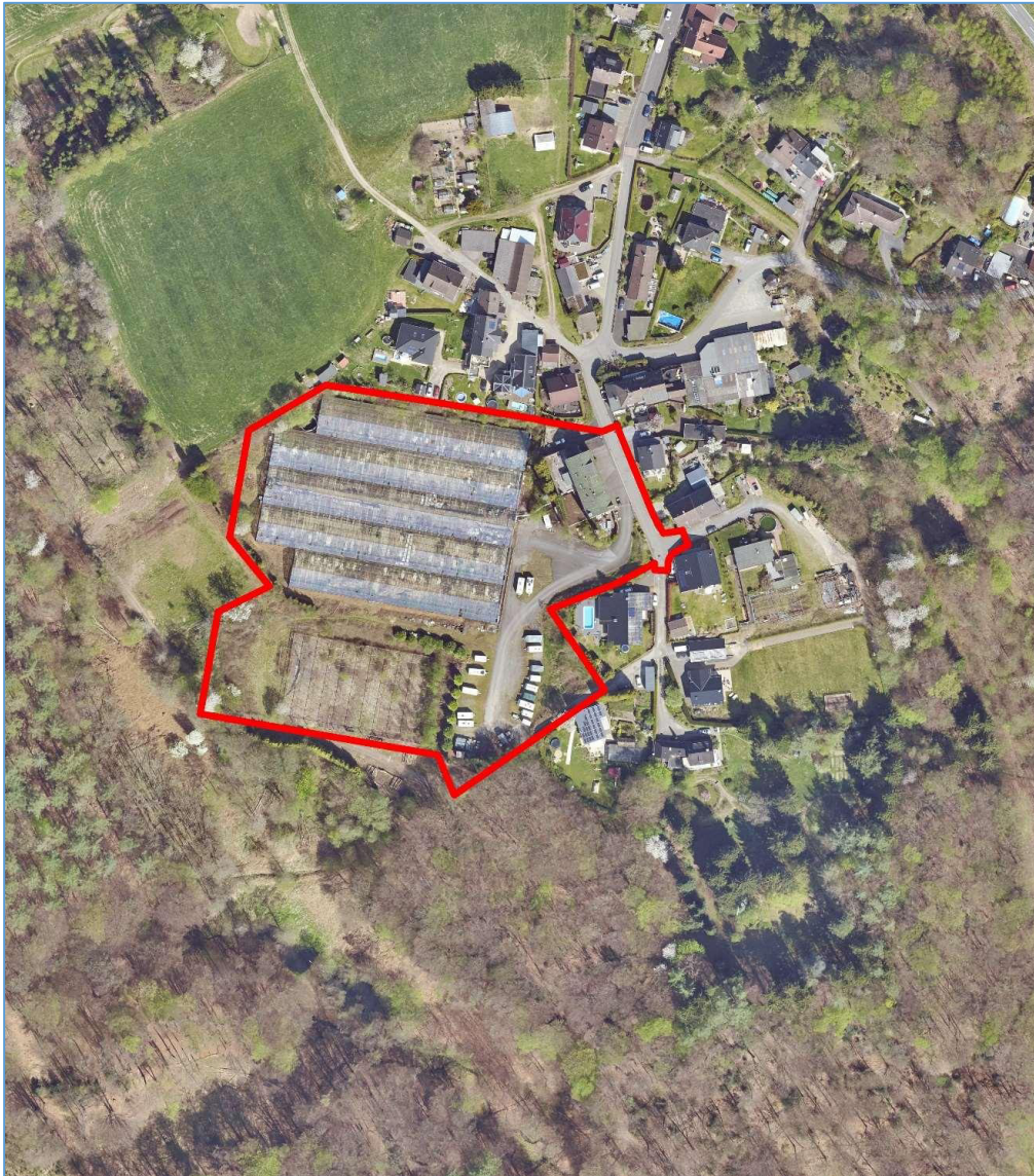
Luftbild © Amt für Liegenschaftskataster und Geoinformation, Rheinisch-Bergischer Kreis, 2020