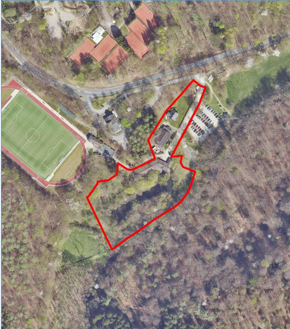
Luftbild © Amt für Liegenschaftskataster und Geoinformation, Rheinisch-Bergischer Kreis, 2020