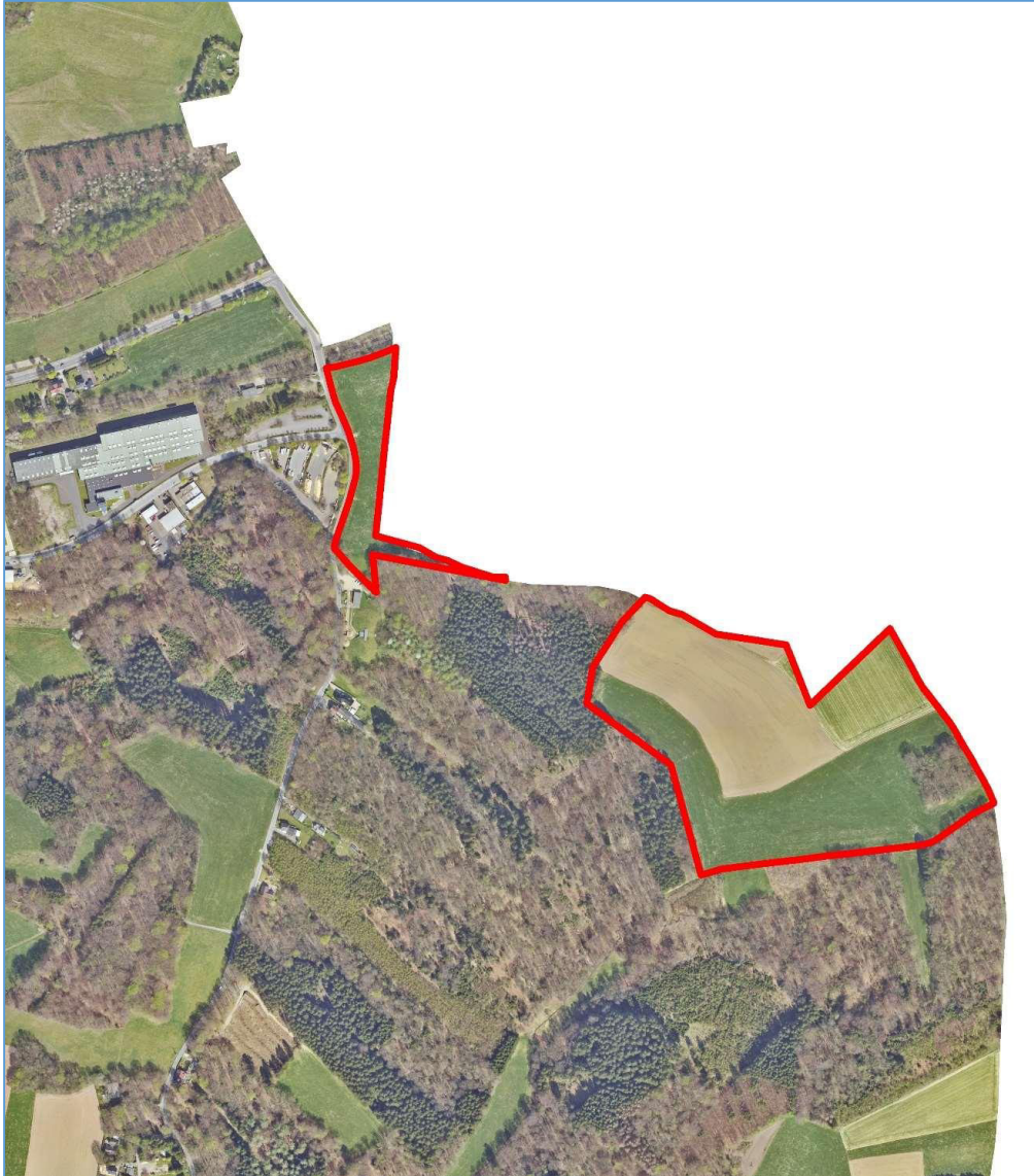
Luftbild © Amt für Liegenschaftskataster und Geoinformation, Rheinisch-Bergischer Kreis, 2020