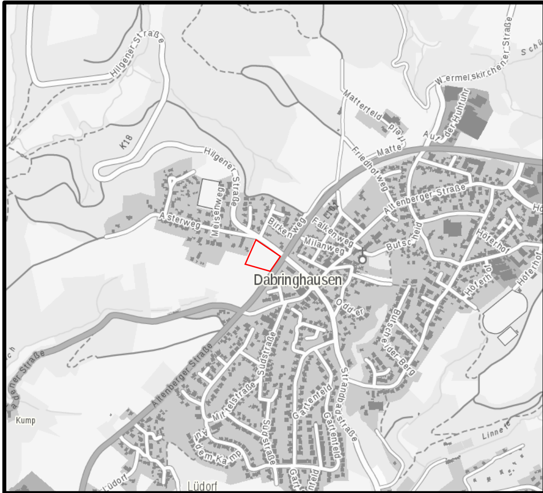
Abb. 1: Lage des EG im Stadtteil Dabringhausen, Stadt Wermelskirchen

gelegenen Grenzen sind entlang der Umzäunung mit hohem, dichtstehendem Gras bewachsen. Bei den südlichen und südwestlichen Parzellen handelt es sich ebenfalls um mit Fettgräsern bestandenes intensiv genutztes Grünland.