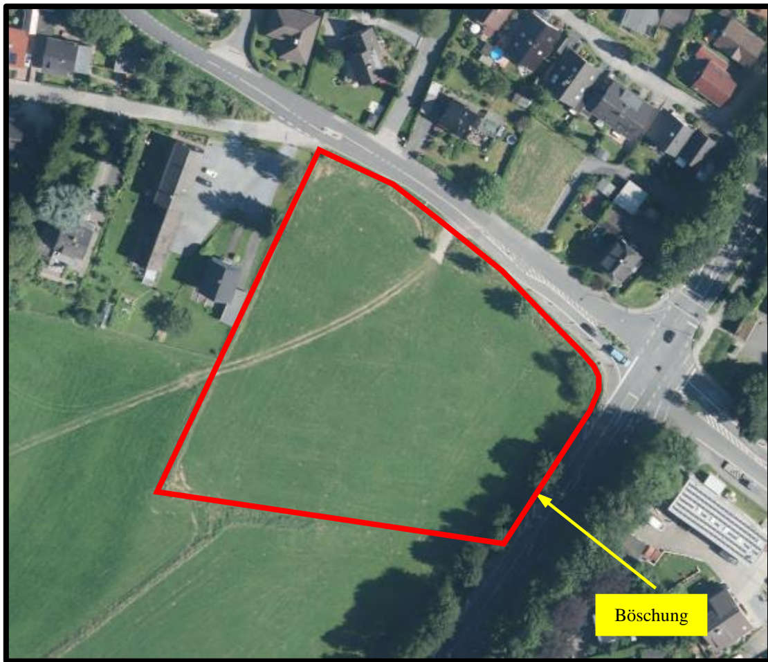
Abb. 2: Überblick über EG und Umland

Fotodokumentation siehe Folgeseiten: